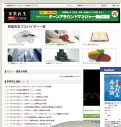
▲事業再生オンラインにも掲載