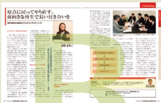
▲御社の強みや特徴を取材記事で詳細に掲載

見開き全面で取材記事で構成します。第三者の視点による客観的な記事は、読者に企業の取り組み姿勢を正確に伝えることが可能です。