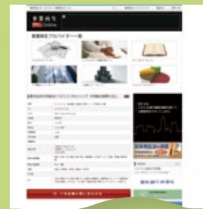
▲連動して「事業再生オンライン (WEB)」へも同記事の掲載を致します (無料)。