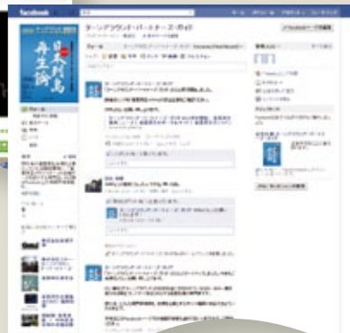
▲FaceBook ユーザーへ投稿による情報発信・共有が可能

ターンアラウンド・パートナーズ・ガイドの公式 Facebook ページを活用した情報発信、共有が可能です。