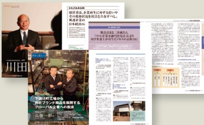
▲ターンアラウンドの世界をわかりやすく紹介

有識者インタビューやターンアラウンドの業界情報等を掲載します。その他、専門用語の解説集や関連団体の連絡先等、使える資料を掲載。年間を通じご利用いただける構成で編集します。