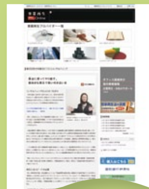
▲連動して「事業再生オンライン (WEB)」へも同記事の掲載が可能です (掲載料は別途)。